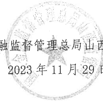
国家金融监督管理总局山西监管局