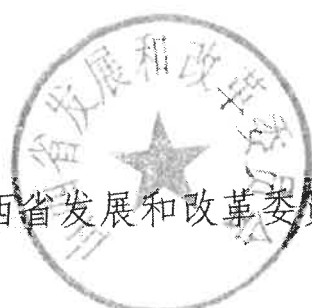
山西省发展和改革委员会