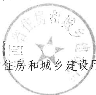
山西省住房和城乡建设厅

工程建设各方主体合法权益，根据《中华人民共和国建筑法》《中华人民共和国民法典》《保障农民工工资支付条例》《山西省建筑工程质量和建筑安全生产管理条例》《住房和城乡建设部等部门关于加快推进房屋建筑和市政基础设施工程实行工程担保制度的指导意见》有关精神，结合我省工作实际，山西省住房和城乡建设厅等六部门对《建设工程保证担保实施办法（试行）》进行了修订，现将修订后的《建设工程担保实施办法》印发给你们，请认真贯彻执行。