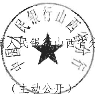
中国人民银行山西省分行